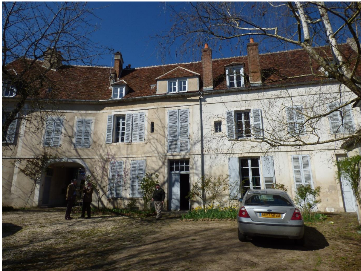
Façade intérieure de la maison de Marie Noël

Dans la partie C au rez-de chaussée de la maison, se trouve la grande salle de conférences de la Société des Sciences avec un empoutrement du XVI e siècle et un escalier conduisant aux étages avec une rampe Henri III.